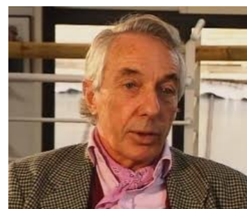
Philippe de Broca